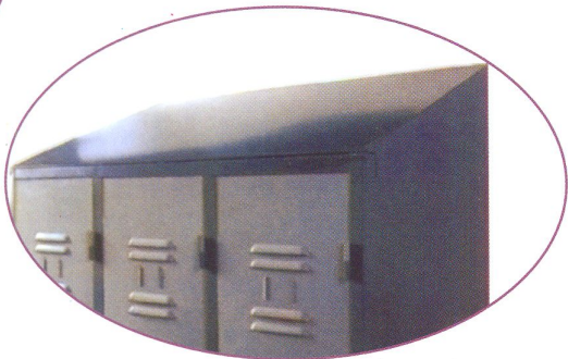
DETALLE TECHO INCLINADO